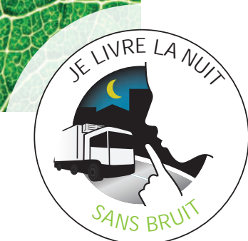
label des transporteurs