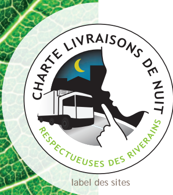
label des sites

L'association CERTIBRUIT® associe tous les intervenants concernés par la labellisation pour assurer la gouvernance de la charte avec les transporteurs qui souhaitent obtenir le label « Je livre la nuit sans bruit dans le respect des riverains et de l'environnement ».